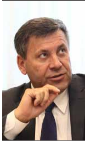
Janusz Piechociński , poseł, Polskie Stronnictwo Ludowe